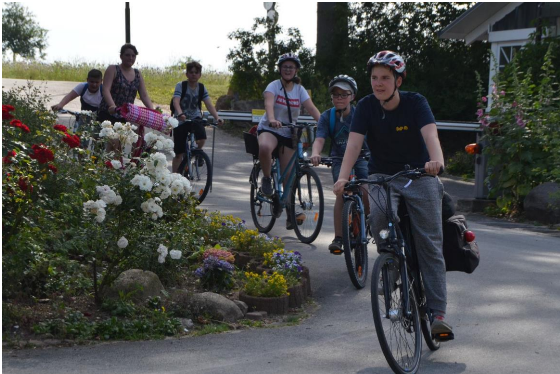
Übernachtung auf dem Campingplatz